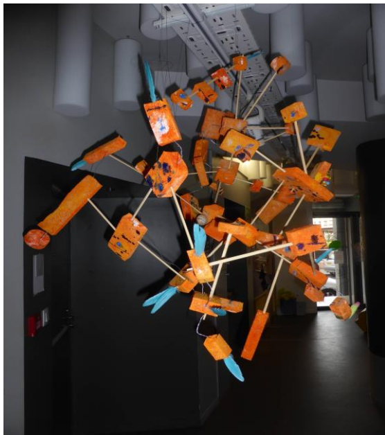
Mousses de récupération peintes par les enfants