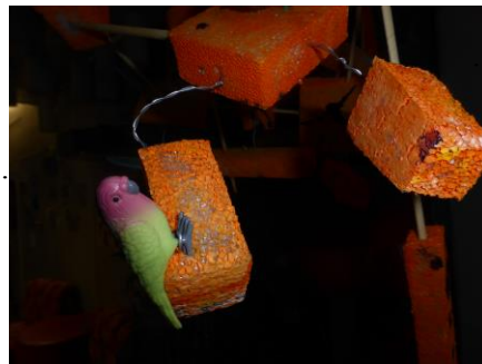
Petits objets de récupération collés sur les mousses Par les enfants